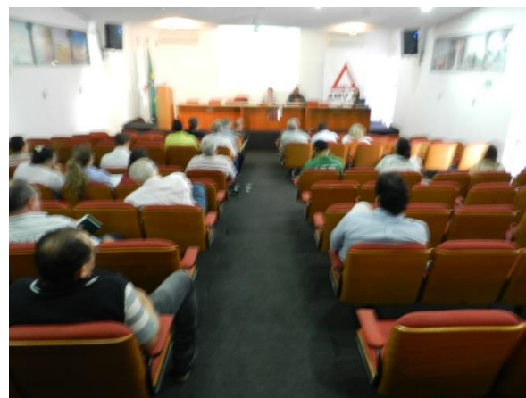
Figura 3: Fotos das Reuniões Plenárias do CBH Araguari.