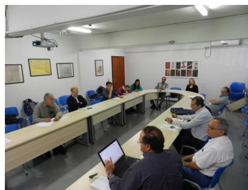
Figura 4: Fotos de Reuniões das CTs e GTs do CBH Araguari.